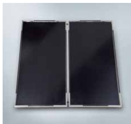
Pločasti kolektori Vitosol 100-FM (Tip SVK)

Inteligentni sloj apsorbera štiti kolektore od pregrijavanja. Viessmann je patentirao tehniku ThermProtect koja zaustavlja primitak sunčeve energije u ovisnosti o temperaturi. Iznad temperature od cca. 75 °C mijenja se kristalna struktura apsorberskog sloja, mnogostruko se povisuje zračenje topline u okolinu i smanjuje se predaja topline s kolektora na instalaciju