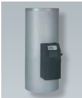
Vitocell 100-B s predmontiranim Solar-Divicon-om

Vitosol 100-FM (Tip SVKG) za integraciju u krov