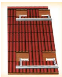
Montaža na krov